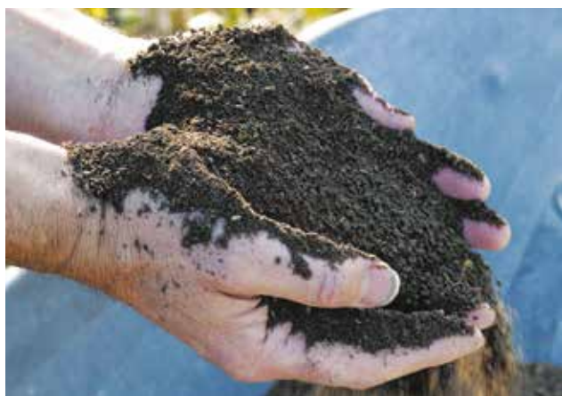
Le compost mûr se caractérise par sa couleur foncée et sa structure grumeleuse.

Il favorise la croissance des plantes et leur développement racinaire.