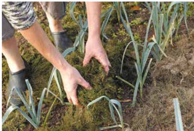
Pour pailler, on peut utiliser des tontes de pelouse, des feuilles mortes, des brindilles ou des déchets végétaux de cuisine.